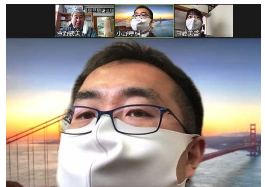
【オンラインミーティング】

この機能を備えていると、コロナ禍で臨時休業になったとしても、動画を使用してのオンライン学習やオンライン授業も可能になります。気仙沼市教育委員会では、家庭にWi-Fi機能がない時には、機器を貸し出すことも考えております。なお、タブレットについては、学校備品であることから貸し出しはしますが、卒業時には学校においていくこととなりますので丁寧に使用してほしいと思います。