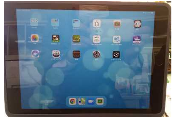
【配布されるタブレット】

気仙沼市教育委員会はGIGAスクール（ギガスクール：義務教育を受ける児童生徒のために、1人1台の学習者用PCと高速ネットワーク環境などを整備する5年間の計画）構想に基づき、1月から1人1台タブレットを配布するとともに、ICT（情報通信技術）を活用し、「時間・距離の制約なく良質な学びを提供」、「個別に最適化された効果的な学びや支援」、「教師の経験知と科学的視点を融合」させることで「子どもの力を最大限に引き出す学び」を実現させる取組を行っています。このことにより、これまででは図書室で調べていたものをネット上で検索できるほか、Web上に個々の引き出し「ボックス」を作成し、そこに学習した成果を蓄積し、必要な時にそこから引き出すなど様々な活用ができます。