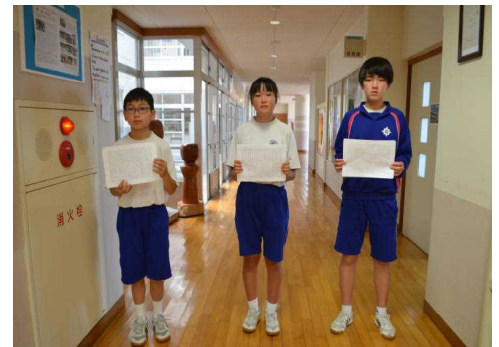
【第2学期始業式で抱負を発表した3人】

新型コロナウイルス感染症拡大防止により臨時休業を余儀なくされ、授業時数を確保するための方策として、気仙沼市立小中学校は例年よりも短い夏休みとなりました。県中総体、駅伝練習に汗を流したり、各種コンクールに向けて作品を作ったりできた、例年の夏休みとは違い、今年度の夏休みはどうだったでしょうか？（ちなみに私の中学校時代の夏休みは、部活動（陸上部）が終われば、溪流で岩魚（イワナ）や山女魚（ヤマメ）を、沼で鯉（コイ）、鮒（フナ）を釣る毎日とても楽しかったです。部活動の前に行くこともあるぐらいの「釣りキチ」でした。3年生の時は、朝、駅伝練習が終わると、その後、弁当を持って市立図書館に通い、受験勉強をしていました。）