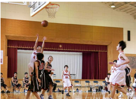
[男子バスケットボール]