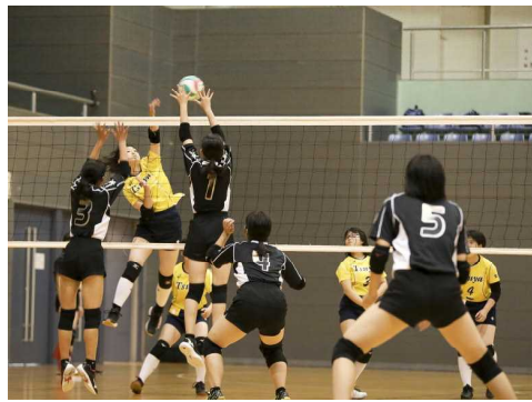
[女子バレーボール]