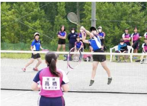
[女子ソフトテニス]