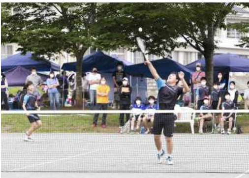
[男子ソフトテニス]