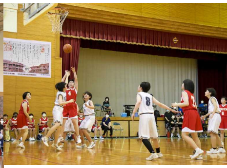
[女子バスケットボール]