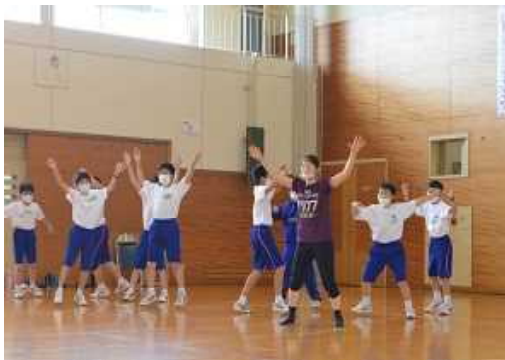
[創作ダンスのーコマ]