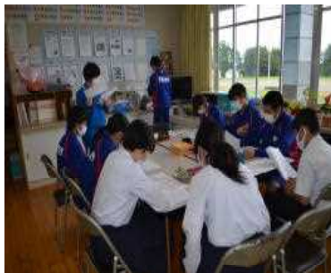
【放送による生徒総会の様子】

生徒会の今年度の活動テーマや行事、予算など審議する総会が放送を通して開催されました。生徒会テーマについては、今年度の生徒会ビジョンである「一人一人が津谷中に誇りを持ち、笑顔と活気に満ちた生徒会」に沿って各学級で考えた中から1つに絞ります。その結果、令和2年度津谷中学校生徒会テーマについては、全校投票の結果、3年1組と3年2組から提案されたテーマが、僅差であり、どちらも全校生徒の過半数にいたらなかったことから再度「選挙」または「投票」を行うことになりました。