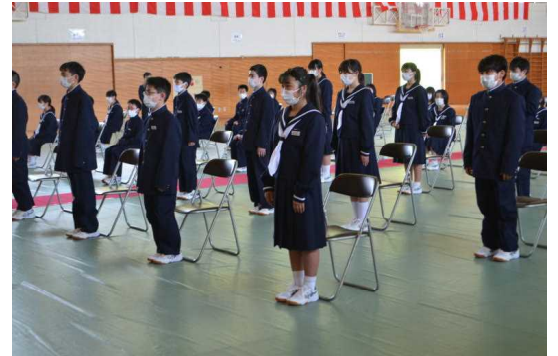
【入学生呼名の様子】

今後変化の激しい社会を力強く生き抜いていくには、中学生のうちに基礎となる力を付けていくことが必要である。それには、『自立』ということが大切になる。『自立』とは、わかりやすく言えば、その時、その場で、どのような行動が適切か、自分で考え、判断して、行動することである。」という話をしました。