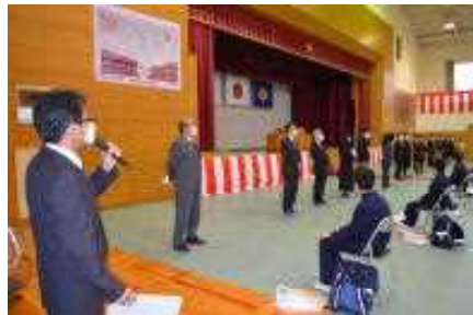
〔はじめに職員を紹介〕