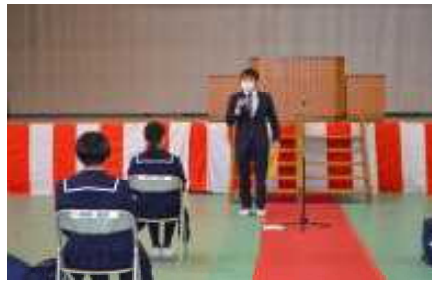
〔2年生のオリエンテーション〕