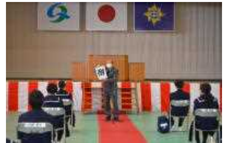
〔次に校長からの激励〕