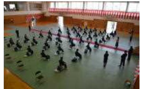
〔1年生のオリエンテーション〕