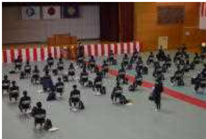
〔3年生のオリエンテーション〕