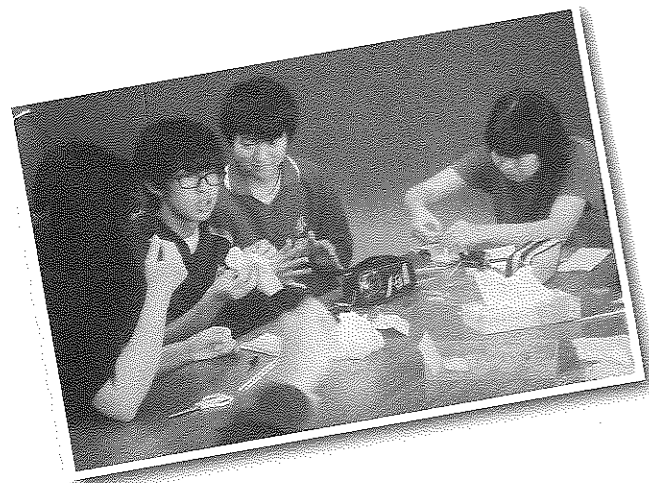
「ハーバリウムボールペン製作」