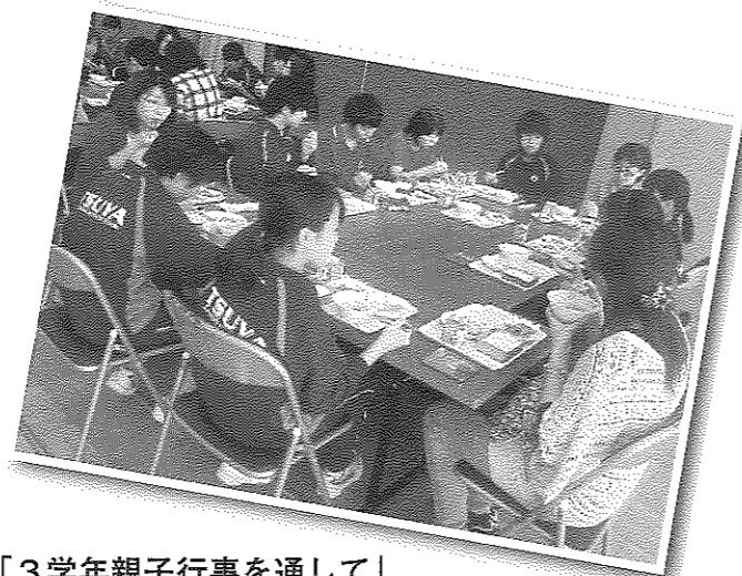
「3学年親子行事を通して」