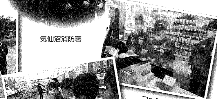
ファミリーマート 本吉バイパス店