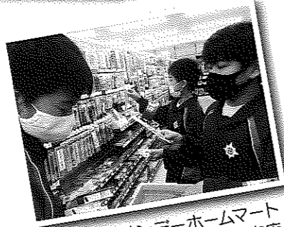
サンデーホームマート 本吉店

図書館では、カウンター業務や、本の整理、本のカバーがけをしました。お客様を接客するのは初めてで、大変なことが多く失敗もありましたが、働くことの大切さや、喜びを感じることができました。