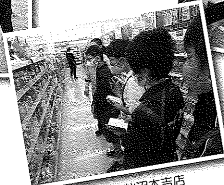
薬王堂気仙沼本吉店