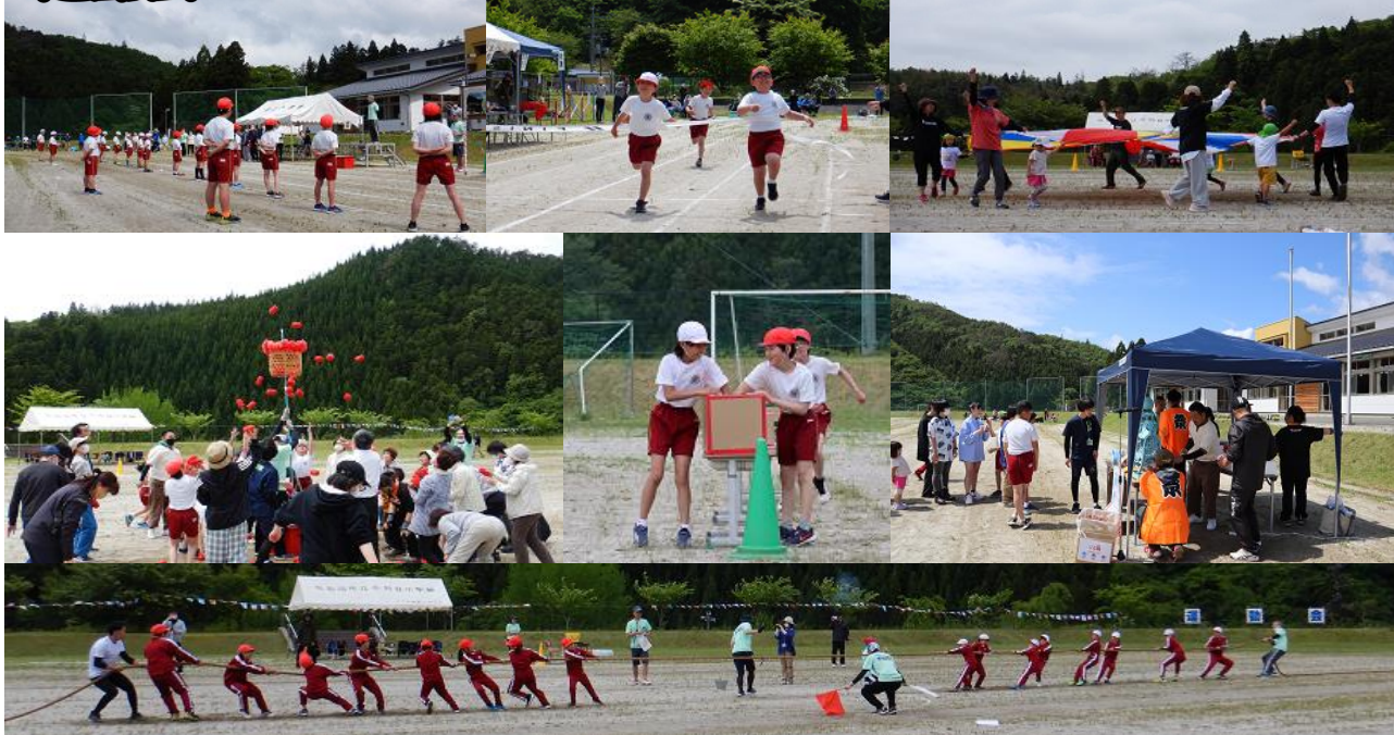
左上から時計回りに「開会式」→「1・2年徒競走」→「月立保育所の皆さん」→「YASSE CORREE」→「借り物競走・抽選」→「玉入れ」→「綱引き」

5月20日（土）月立小学校運動会が開かれました。今年度は、5月8日に新型コロナウイルス感染症が5類に移行したこともあり、保護者の皆様だけでなく、来年度入学予定の皆さんや月立保育所の皆さん、そして、たくさんのご来賓の皆様にもお越しいただいての開催となりました。