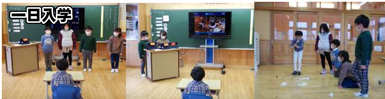
「よろしくお願ひします」