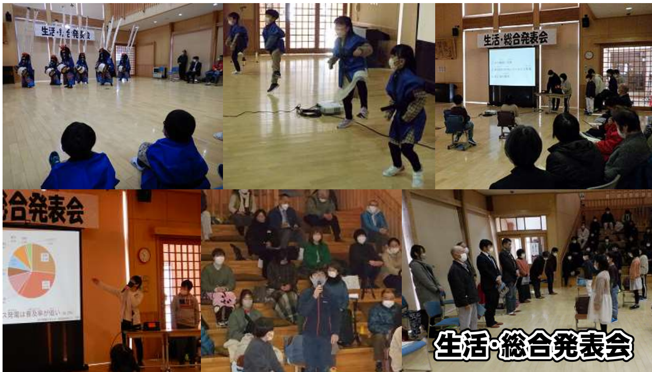
左上写真から時計回りに「ラスト鹿踊り」→「いもほりダンス」→「発表1」→「御来賓の皆様に挨拶」→「感想発表」→「発表2」

気仙沼市立月立小学校 学校だより 令和5年2月24日発行 文責：月立小学校 教頭 TEL：0226(55)2260