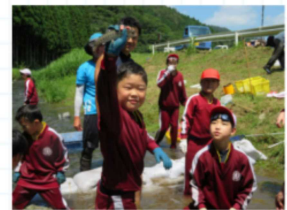
気仙沼市立月立小学校 未来へつなぐ人材の育成 —自分らしく幸せに生きる人づくり—

さらに、昨年度の本校のESDの取組が良い事例として、日本ユネスコ協会連盟アシストプロジェクトのホームページに掲載されました。地域の皆様からのご支援のおかげで、「未来へつなぐ人材の育成」を目指したすばらしい学びができていることを、全国に発信する機会をいただいています! テレビ番組でも最近多く取り上げられているSDGs。八瀬は、地域まるごとで取り組んでいるように思います。12月21日(火)には、5・6年生が京都や九州の学校の子供たちとオンラインで意見交換を行いました。これからも自信をもって八瀬のよさを発信していきたいと思えます!