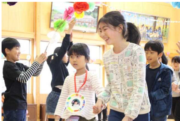
《だれにでもやさしい子》

19日、児童会行事「はじめまして集会」が行なわれました。1年生のためにみんなで一生懸命準備し、温かく楽しい会となりました。みんな笑顔になりました。