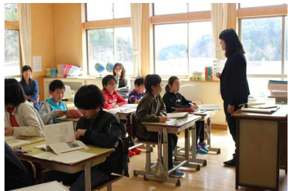
《ていねいに学ぶ子》

今年度は全学年で複式学級となり、参観日には、複式の授業を参観していただきました。上学年がよい手本となって、授業が進められています。