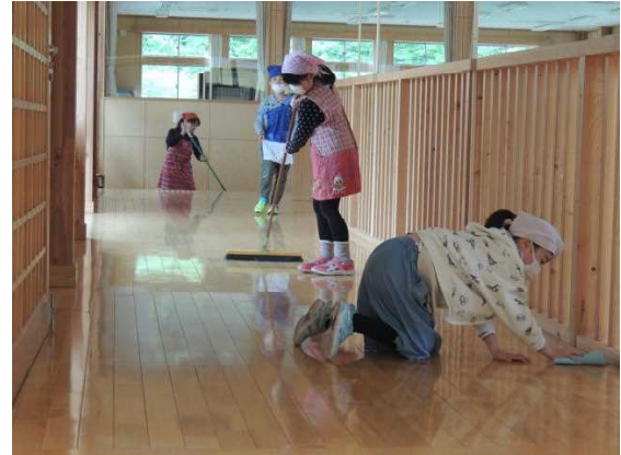
《気持ちよきはたらく子》

今年度は、「無言清掃」を目標に、清掃活動に取り組んでいます。大切な学舎である月立小学校をぴかぴかにするためにみんなでがんばっています。