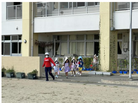
【校庭への避難の様子】

子供たちは放送や先生方の指示をきちんと聞き,終始真剣な表情で訓練に臨むことができました。実際に地震が起こった場合にも,今回の訓練での行動の仕方を思い出し,しっかりと自分の命を守れるようにしてもらいたいと思います。