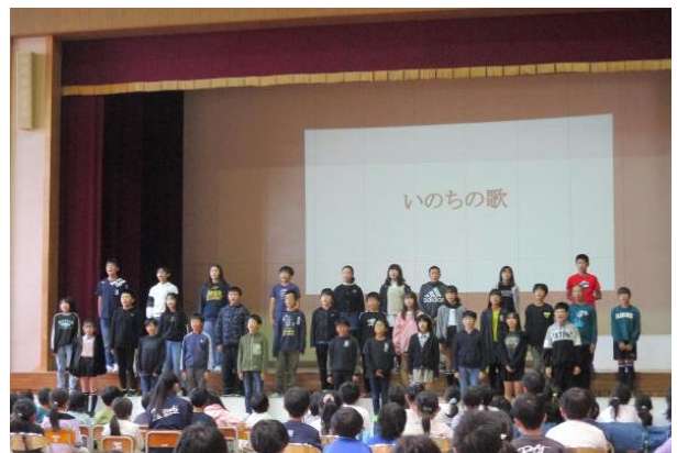
6年生…心を込めて群読と合唱を贈ります。