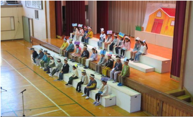
1年生…開会のことばと音読劇を頑張ります。