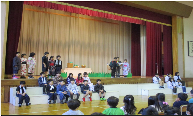
3年生…力を合わせてゆかいな劇を演じます。