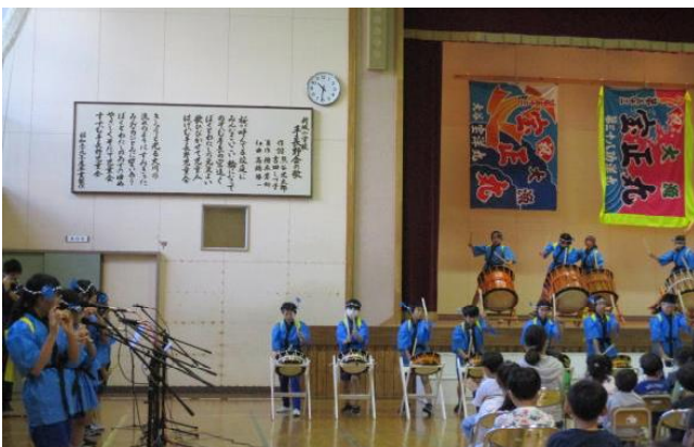
5年生…新城打囃子を力強く披露します。