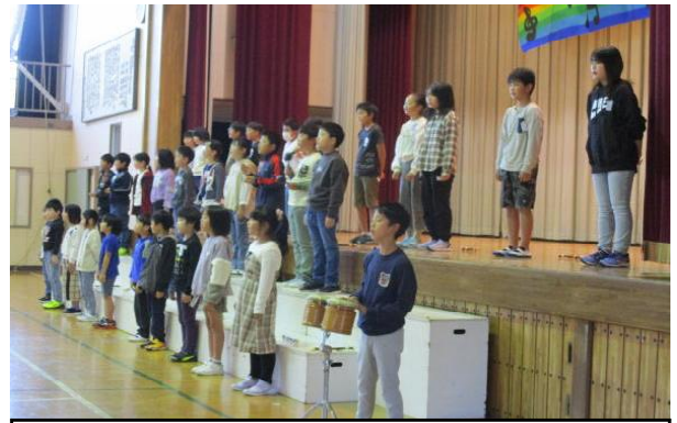
4年生…きれいなハーモニーと演奏を届けます。