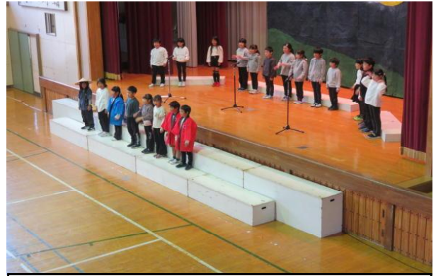
2年生…心あたたまる昔話の音読劇を演じます。