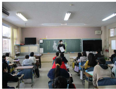
3月までの予定や、今週の学習予定を集中して聞きました。…5年生