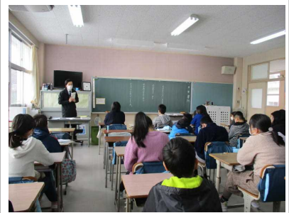
家庭での読書の様子を話し合い、担任が勧める本の話の話を聞きました。…6年生