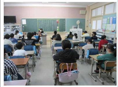
健康観察で自分の健康と持ち物の確認についてしっかりと話しました。…3年生