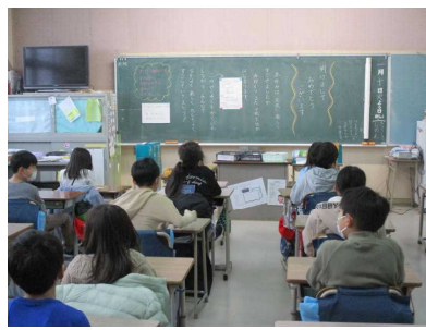
放送朝会の校長先生のお話を良い姿勢で真剣に聞きました。…2年生