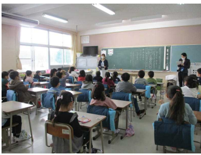
3月までの予定を聞き、2年生進級に向けたためあてを考えました。…1年生