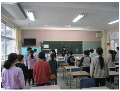
朝の会では、係の人の指揮で、皆で明るく今月の歌を歌いました。…4年生