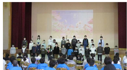
6年生…心を込めて劇と開会のことばを贈ります。