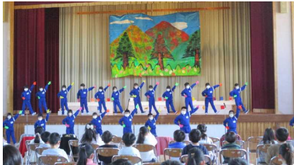
1年生…開会のことばと音読劇を頑張ります。