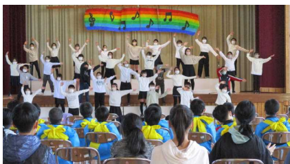
4年生…歌とボディパーカッションで盛り上げます。