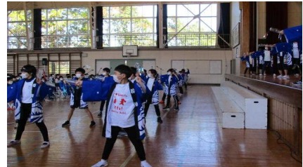
3年生…群読と力強い踊りを披露します。