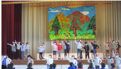
2年生…楽しい音読劇を演じます。