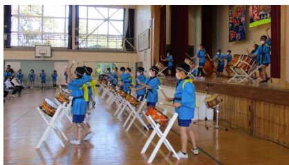
5年生…練習を積んだ新編打雑子を披露します。