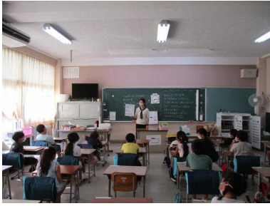
担任の話をしっかり聞いていました。…1年生