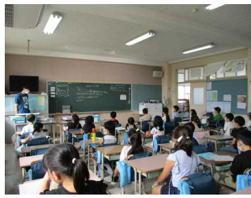
校長先生のお話をうなずきながら聞いていました。…2年生