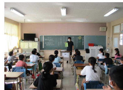
今月の生活の目標を皆で確かめました。…6年生