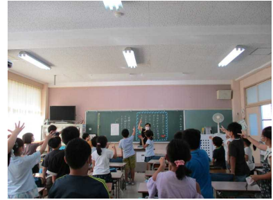
朝の会のお話を決めるため元気にじゃんけん。…3年生