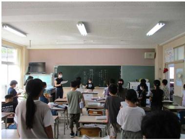
係の子のリードで元気に朝の歌を歌います。…4年生