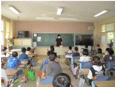
今週の予定を真剣に聞いていました。…5年生