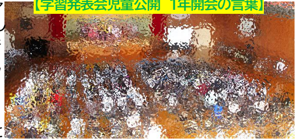
【学習発表会児童公開 1年開会の言葉】

さて、学習発表会と並行して校庭でのランニングを推奨し、体力の向上を図る「大谷クエスト」を2学期から開始しました。業間休みや昼休みには、自分から校庭を走る子供たちが多く見られています。秋に色づく校庭を粘り強く走る子供たちへのお励ましを御家庭でもどうぞお願いします。