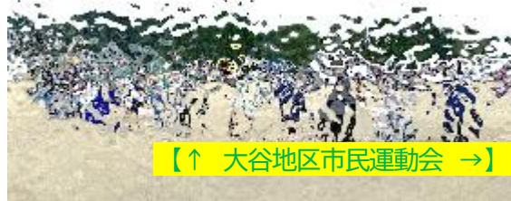
【↑ 大谷地区市民運動会 →】