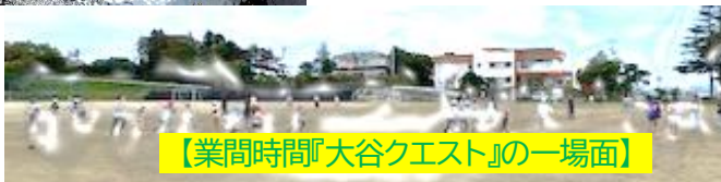
【業間時間『大谷クエスト』の一場面】