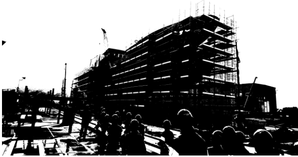
(株)みらい造船で建設中の船を見学

天候にも恵まれ、予定通りに行われました。普段は見ることのできない「(株)みらい造船」の見学、普段は聞くことのできない宮城県北部船主協会と気仙沼海上保安署による職業講話、そして大島汽船の乗船体験と、学校を離れて価値ある学習や体験ができました。このセミナーを通して、船を造る職業、船に乗る職業、海の安全を守る職業について学びました。