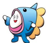
大谷中キャラクター 「マンバイ」