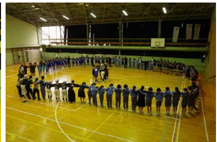
【盛り上がった伝統の円陣】