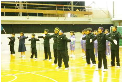
【応援団の見事なエール】

5月25日(木)、生徒会による中総体壮行式が体育館で 行われました。大会に向けた意気込みがしっかり伝わって きました。