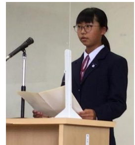
< 立会演説会の様子 >