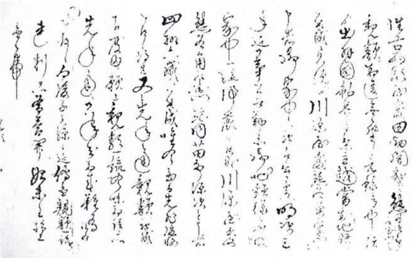
▲古文書三通内熊谷家 明治十年の親類願い入れ文・写真▲