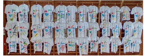
6年生が作成したTシャツ