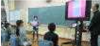
3年総合の発表（参観日）