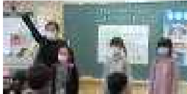
2年町探検の発表（参観日）