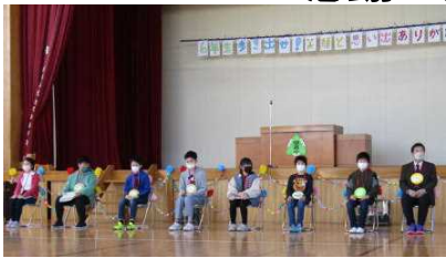
全校のみんなで飾った手作りの会場に6年生を迎えました。