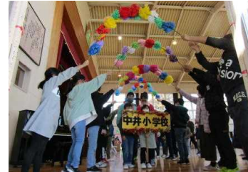
手作りの花のアーチで退場を見送りました。