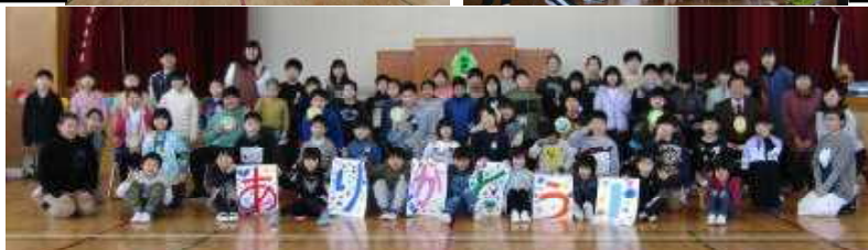
全校のみんなで記念写真を撮りました。