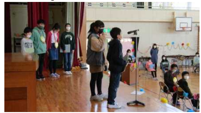
1～5年生の出し物のあと、児童会の引き継ぎ式を行いました。