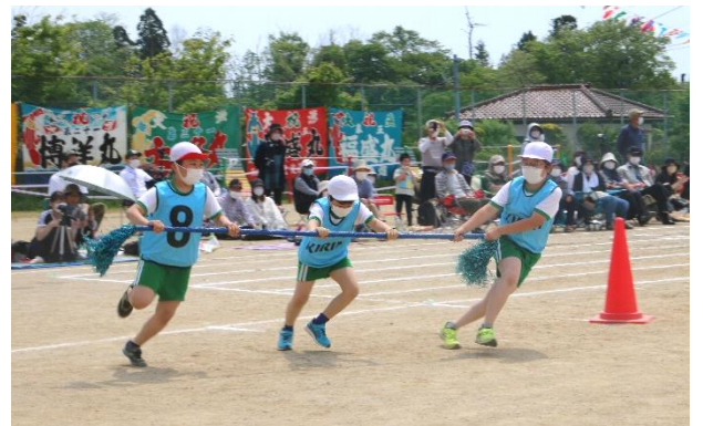
(「中井タイフーン！」の様子)