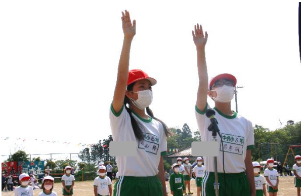
(開会式 選手宣誓の様子)

運動会の開催にあたって、低学年の児童管理や駐車場の誘導、会場設営や競技の準備といった運営、終了後の後片付けなど様々な面で多大な御支援をいただいた父母教師会本部役員の方々や学年委員さん、そして保護者の皆様には、本当にお世話になりました。一つ一つの行事を実施するたびに、学校が御家庭や地域の皆様に支えられていることを実感しております。本当にありがとうございました。今後とも本校の教育活動への御理解と御協力をどうぞよろしくお願いいたします。