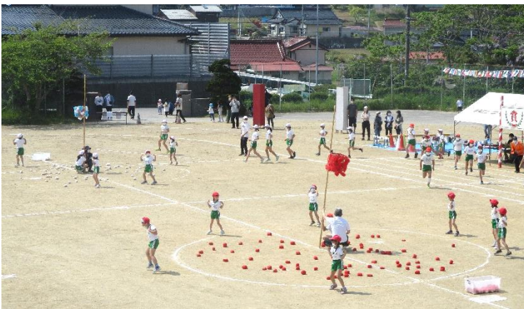
(「ダンシング玉入れ」の様子)