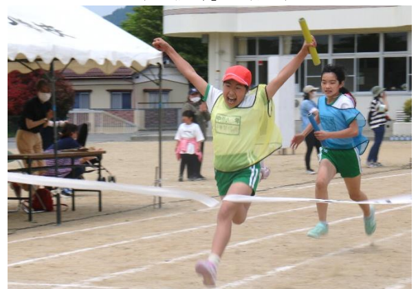
(「縦割りリレー」 ゴールの様子)