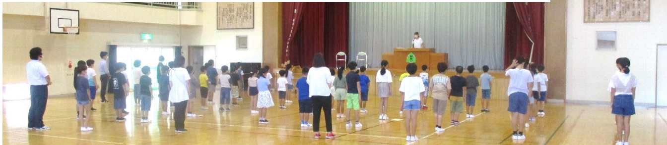
(体育館での夏休み明けの会の様子)

学校に子どもたちの元気な姿が戻ってきました。2学期制の導入のため10月に秋休みがある関係で、昨年度よりも若干短くはなりましたが34日間の夏休みを終え、1学期の後半がスタートしました。今年度も様々な制限の中ではありましたが、思い思いに夏休みを過ごすことができた子供たちは、夏休み前よりも一回り大きく成長した雰囲気を感じられ、新たに再開した学校生活への期待が瞳の輝きに表れていました。