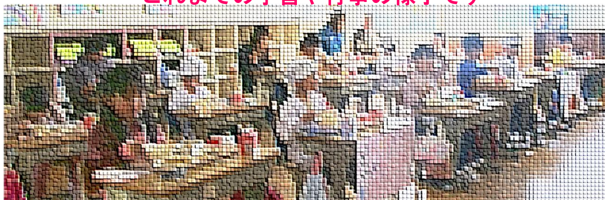
(↑ : 来年度入学予定の年長児さんと1年生との交流給食の様子)