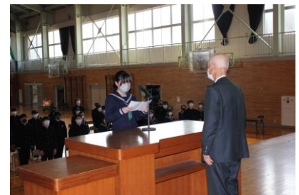
同窓会入会式の様子

さらに、1日(水)には同窓会長をお招きし、同窓会入会式を行いました。3年生は、1万人余りの同窓生の仲間入りを果たし、これからの新しい環境での生活に思いを馳せているようでした。なお同窓会から皆勤賞(3年間無欠席・無遅刻・無早退)が、4名の生徒に贈られました。