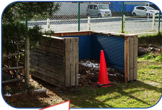
校庭南側に設置された「雑草置き場」