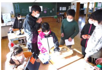
2・3年 わくわく楽しいめいろやさん

11月18日(金)、毎年恒例の児童会主催“小泉っ子ふれあいフェスタ”を開催しました。それぞれの学年が工夫を凝らし、準備から当日の運営まで、子供たちが主体となって行いました。残念ながら今年も保護者の皆様や幼稚園の園児の皆さんに案内を差し上げることができませんでしたが、子供たちはお客さんとしての「楽しさ」とお店屋さんとしての「楽しさ」を存分に味わっていました。