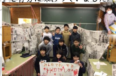
6年 みんなでおいでよ おばけやしき