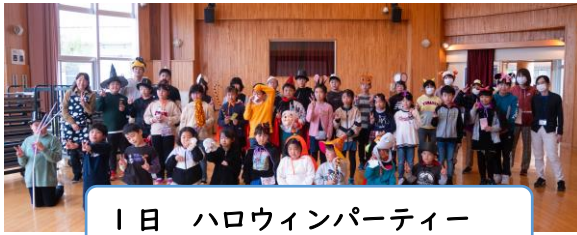
1日 ハロウィンパーティー