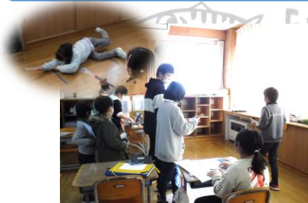
4年 あてて とばして 空気ほう