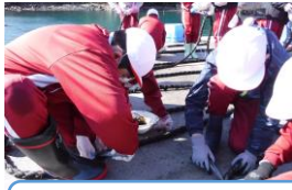
8日 ワカメの種はさみ