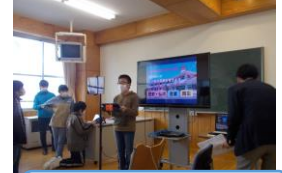
25日 海洋こどもサミット