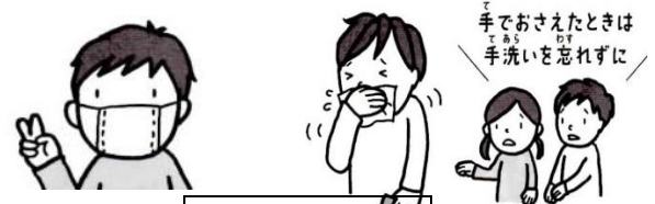
せきエチケ せきエチケ

せきやくしゃみが出る時は、マスクをしたり、人のいない方を向いて鼻と口をおさえたりして、まわりの人にうつさないようにすることが大切です。