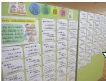
～ぼく・わたしが考えた給食標語～

1月24日から30日までは全国学校給食週間でした。給食に関わる方々への感謝の気持ちを標語や手紙にしたり、下学年と上学年との交流給食を通して、食事のマナーについて考える機会になりました。