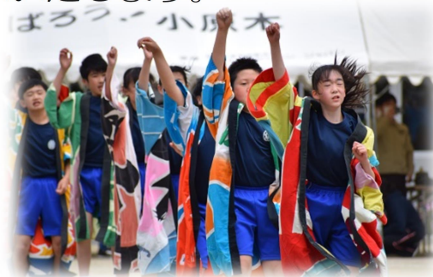
運動会（ソーラン節）