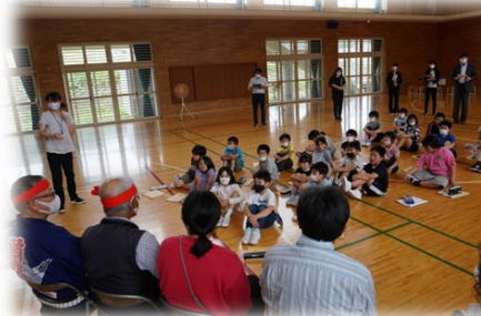
海と生きる探究活動の授業（3年）