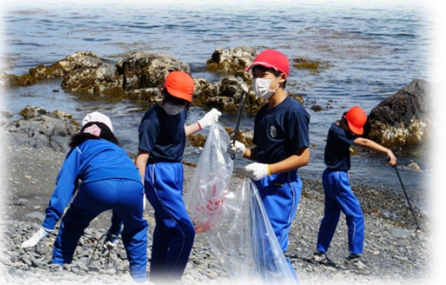
モアクリーンオールシ（5年）