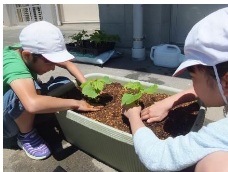
ゴーヤを植えました(4年生, 6/6)