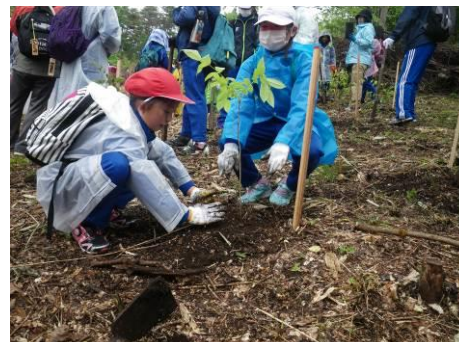
森は海の恋人植樹祭(6/4)