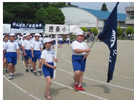
市内体育祭堂々の入場(6/7)