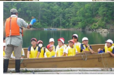
海辺の自然と 生物調査