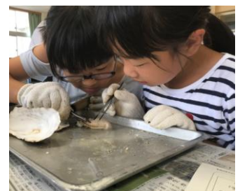
カキの 解剖と観察