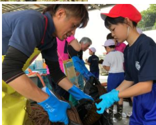
ワカメ種付け体験