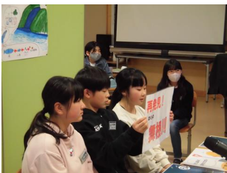
「海の豊かさと環境保全のための取組」についての発信と話し合い