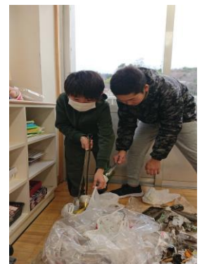
通学路のゴミ拾いと分別