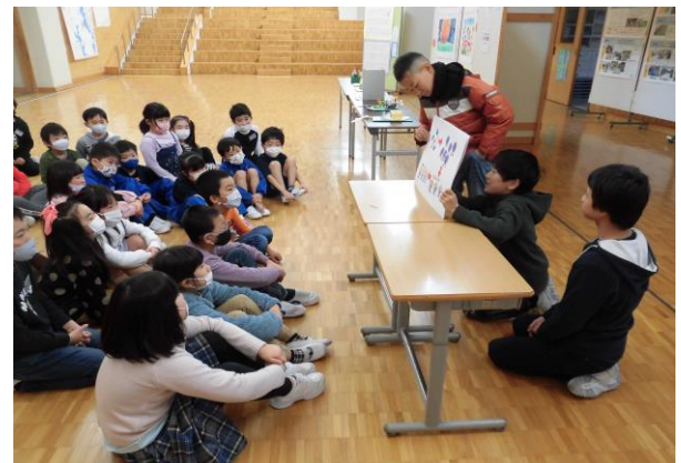
業間や昼休みに「環境とプラスチックゴミ」について紙芝居を披露