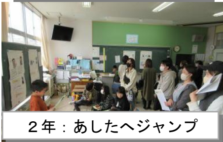
2年：あしたへジャンプ