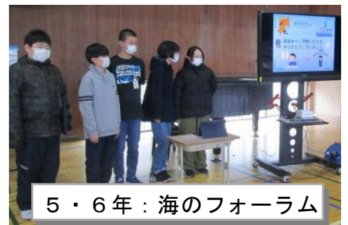
5・6年：海のフォーラム