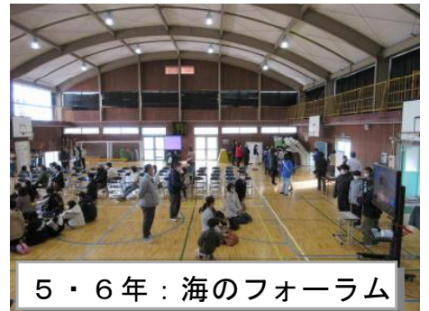
5・6年：海のフォーラム

これまでゲストティーチャーとしてご指導いただきました講師の方々、地域の皆様に改めて感謝申し上げますと共に、今後とも子供たちへのご指導、教育活動へのご協力をお願いいたします。