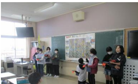
4年：防災マップをつくろう