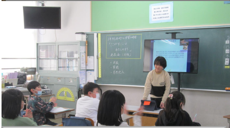
3年：ここがすごい わたしのまち