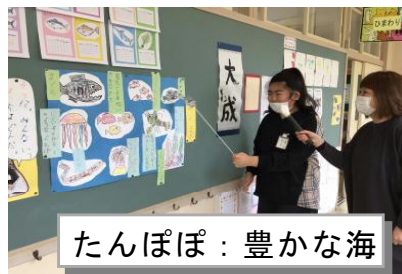
たんぽぽ：豊かな海

2月15日は、授業を参観していただきありがとうございました。1、2年生は、生活科で学習した今年1年の自分の成長を振り返り、楽しかったことやできるようになったことを伝えることができました。3年生は、総合的な学習で学習した自分たちのまちについてすごいと思ったことをまとめ発表することができました。4年生は、地区ごとにタウンウォッチングをして防災マップにまとめたことを最終発表することができました。そして、5、6年生は「海のフォーラム」を体育館で実施しました。総合的な学習の時間で「海」、「自然」、「地域」について見つめ直し、食、環境、産業等との関連を学ぶ中でふるさと気仙沼の恵みを実感し、その恵みを受け自分たちのこれからの生活について考えたことを発表することができました。